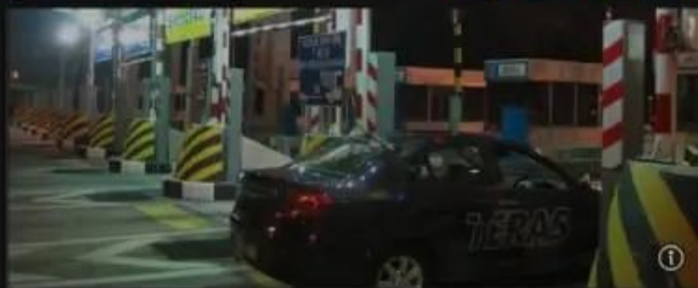
Multi Lane Free Flow (MLFF)